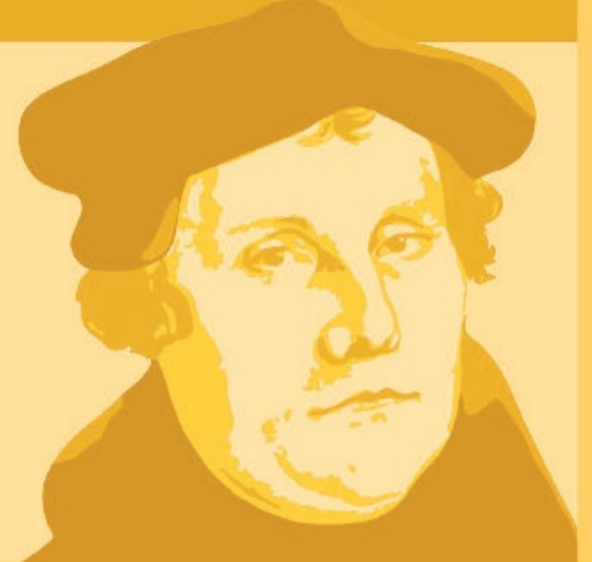
Martin Luther, 1483-1546, Mönch

Martin Luther war als junger Mann ein katholischer Mönch. Er war mit vielem in der Kirche nicht einverstanden und forderte öffentlich, dass sich die Kirche verändern, also „reformieren“ sollte. Die Kirche hatte damals eine große politische Bedeutung. Durch Luthers Forderungen fühlte sie ihre Macht bedroht. Nach erbitterten Auseinandersetzungen kam es zur Spaltung der Kirche und es entstand, neben der katholischen, die evangelische Kirche. Diese Zeit nennt man „Reformation“. Martin Luther war der Erste, der die Bibel vom Lateinischen ins Deutsche übersetzte. Dadurch konnten sie viel mehr Menschen selbst lesen und verstehen.