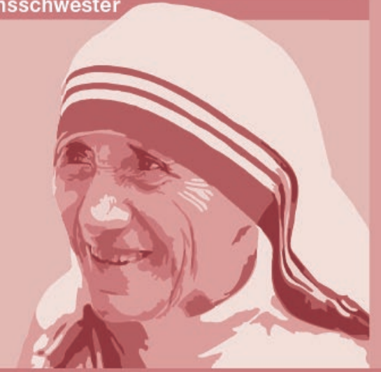
Mutter Teresa, 1910-1997, Ordensschwester

Mutter Teresa wurde als Agnes Gonxha Bojaxhiu im heutigen Nordmazedonien geboren. Sie wurde Nonne und zog in jungen Jahren nach Kalkutta in Indien. Ihre Aufgabe sah sie darin, den Ärmsten der Armen zu dienen. Der von ihr gegründete christliche Orden „Missionarinnen der Nächstenliebe“ kümmerte sich um Menschen, die Hilfe brauchten: Kinder, Kranke, Arme und Obdachlose. Dabei war Mutter Teresa die Religion der Menschen unwichtig. Für ihren Kampf gegen Hunger und Not erhielt sie 1979 den Friedensnobelpreis. In der katholischen Kirche wird sie als Heilige verehrt.