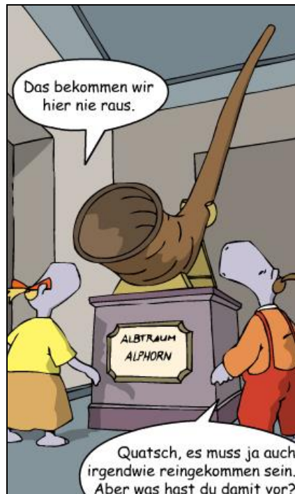
Illustration: Stefan Eiling